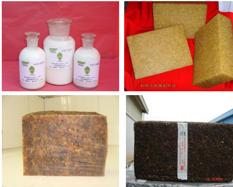
图 3 天然橡胶初加工产品