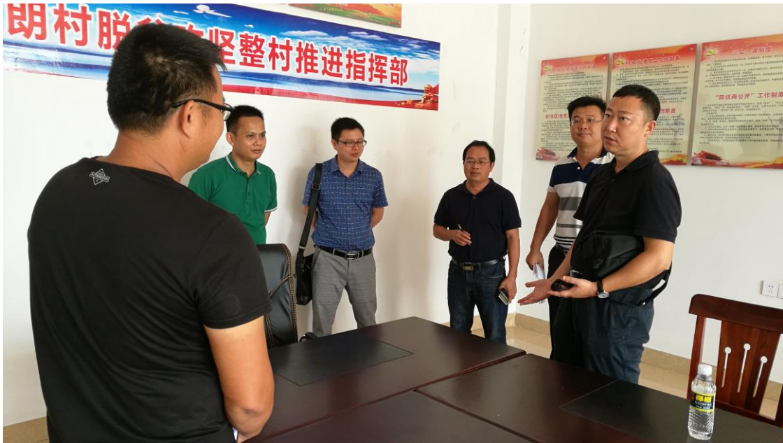
图 13. 在澄迈金江镇高山朗村调研定点帮扶工作

2017 年，公司完成城镇精准扶贫户 522 户 1939 人的复查复核，移交地方 193 户 722 人；组织公司高管和总部部门结对帮扶精准扶贫户；公司总部及下属经纬公司做好省定点精准帮扶单位——澄迈县金江镇高山朗村的精准扶贫工作，2 次支持该村专项扶贫经费共计 40 万元。