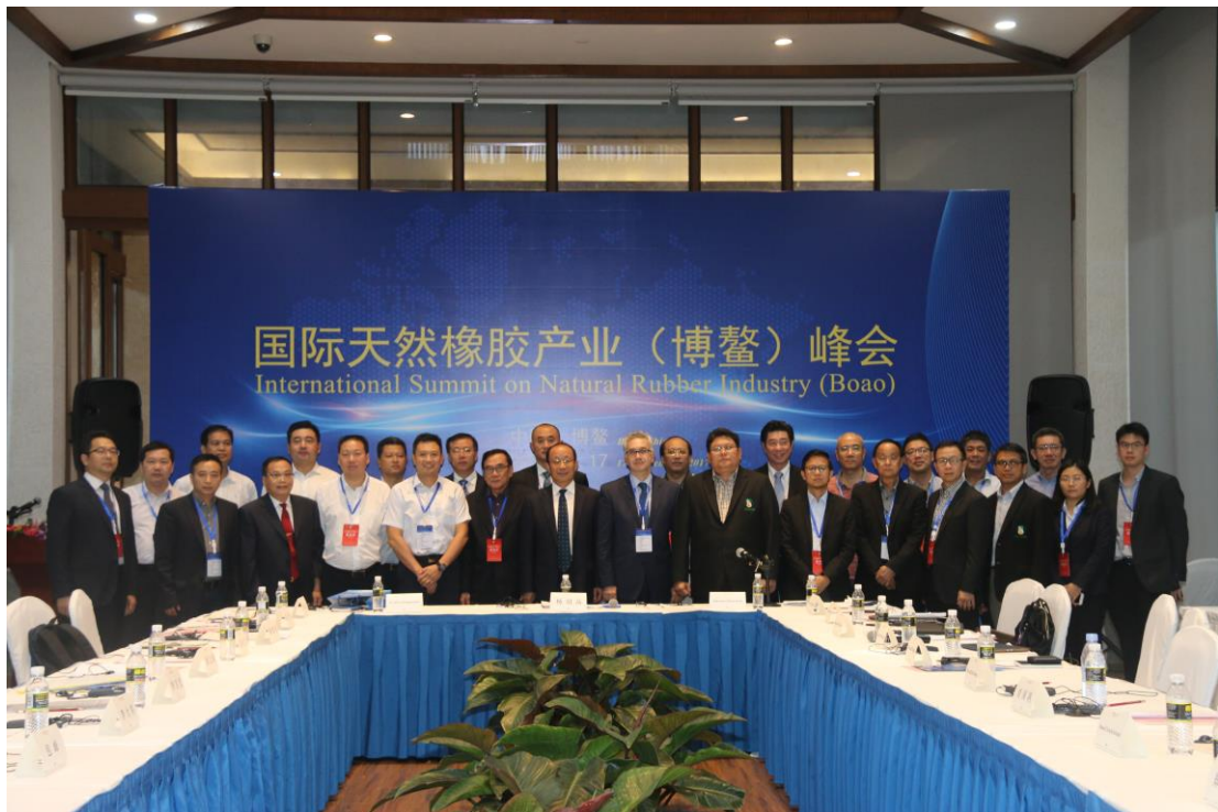
图 11. 国际天然橡胶产业（博鳌）峰会现场