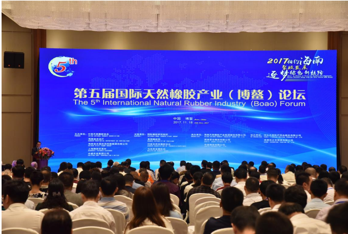
图 9. 第五届国际天然橡胶产业（博鳌）论坛现场

橡胶产业链的相关生产商、贸易商、加工、消费企业、媒体记者等，共 500 多人参加论坛，共谋产业发展。在此次论坛上，公司与中国天然橡胶协会、世界橡胶研究组织、泰国橡胶局和合盛农业集团公司共同签署了战略文件，共同发起成立了天然橡胶全球创新研发中心，拟通过进一步的创新合作，为产业发展创造新的市场空间。