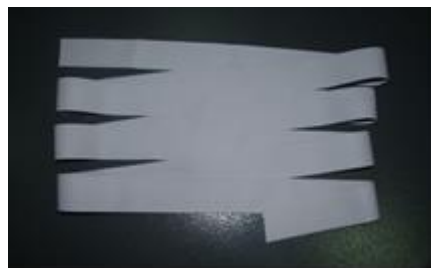
图 4 天然橡胶深加工产品-乳胶丝