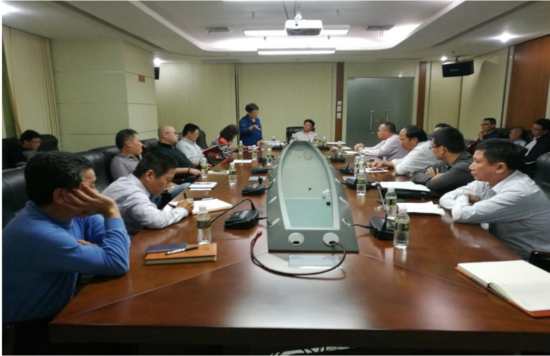
图 6 国军标认证启动会