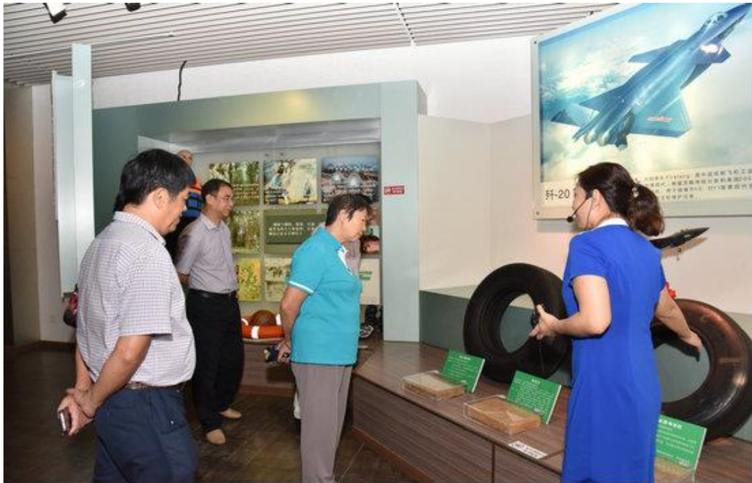
图 7. 陕西政协副主席参观海南橡胶在军用航空轮胎胶研发上取得的成果