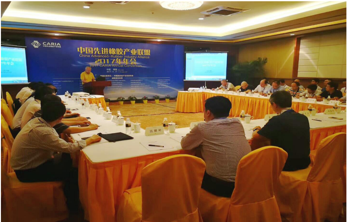
图 8. 中国先进橡胶产业联盟 2017 年年会在海南博鳌召开

2017 年，公司继续发挥主导作用，稳步推进中国先进橡胶产业联盟研发工作。联盟在 2017 年取得了丰硕成果：粘土橡胶项目在第二届中国军民两用技术创新应用大赛中获得优胜奖；开展“海南橡胶在巨型轮胎中的应用”研究工作，先进橡胶材料生产工艺与技术趋于成熟；天然橡胶军用材料的研发取得突破。