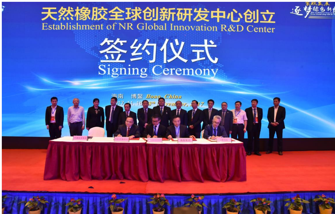
图 10. 天然橡胶全球创新研发中心创立签约仪式