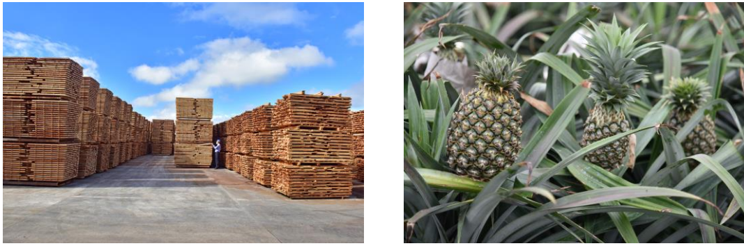
图5 天然橡胶木产品、凤梨