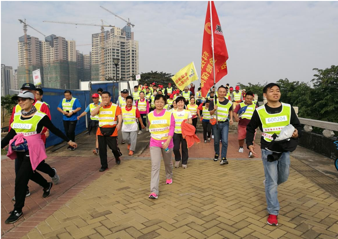
图 12. 直属机关工会组织开展了“幸福海胶、快乐健步”活动

公司组织开展第二届“红林杯”员工羽毛球乒乓球比赛、送文化下基层和游园活动;组织员工参加“我为保盈做贡献·喜迎十九大”员工演讲比赛;开展《“两学一做”暨我为海胶保盈做贡献》员工书画摄影展;组织开展了“幸福海胶、快乐健步”活动。基层单位开展了“海胶之歌”传唱比赛、健步行走、趣味运动会等文体活动。